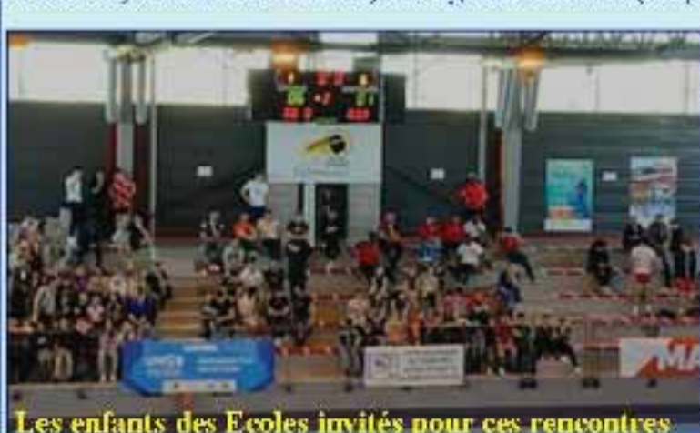
Les enfants des Ecoles invités pour ces rencontres

La journée du mercredi 05 avril 2023 nous a permis d'installer les diverses banderoles, les flammes, d'effectuer la mise en place du secrétariat et de l'accueil,