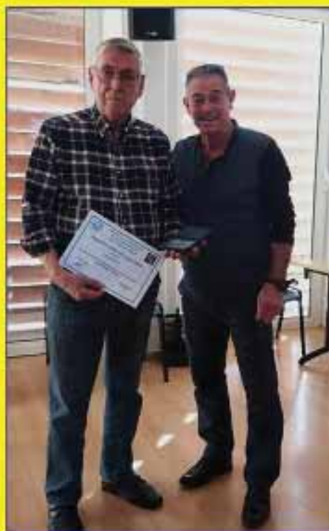
Plaquette Argent PETIN Claude