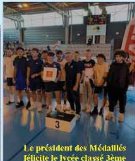
Le président des Médailles félicite le lycée classé 3ème