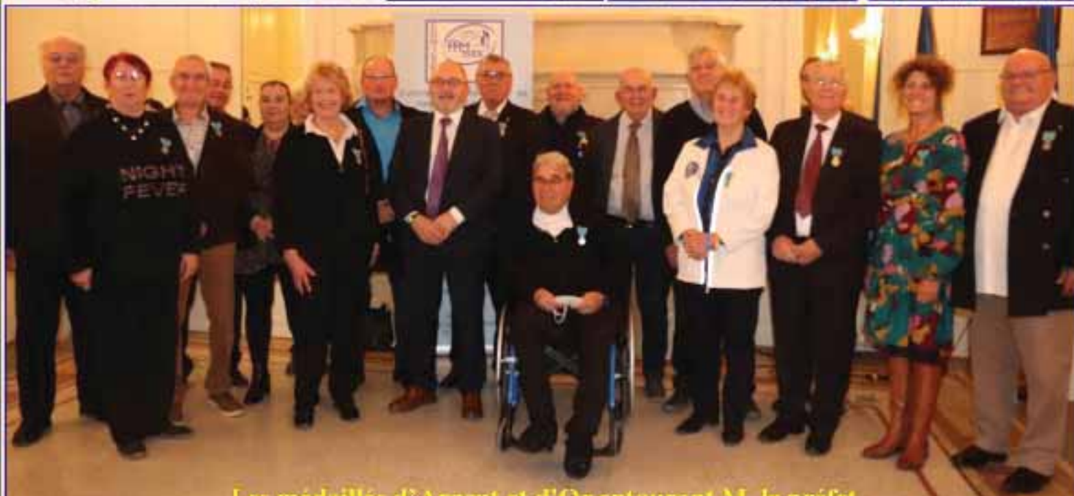
Les médaillés d'Argent et d'Or entourant M. le préfet