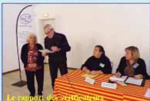
Le rapport des bénéficiaires