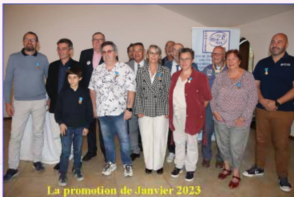
La promotion de Janvier 2023