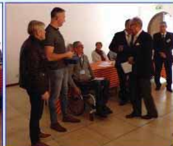
Remise des Challenges sportifs départementaux 2022