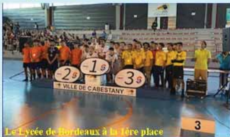
Le Lycée de Bordeaux à la 1ère place