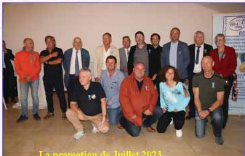
La promotion de Juillet 2023